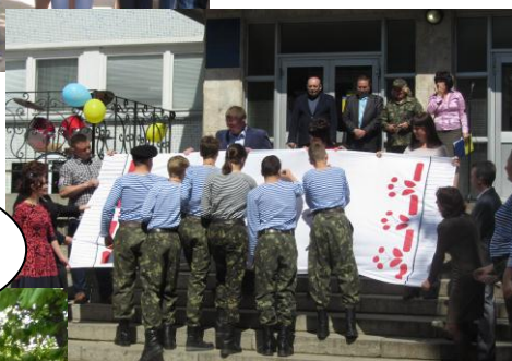
«Спасибі за МИРНЕ НЕБО» від взводу 6(10)В класу

3 Днем перемоги над нацизмом у Другій світовій війні