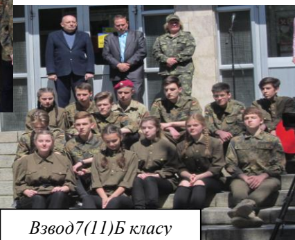
Взвод 7(11)Б класу