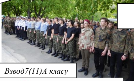
Взвод 7(11)А класу