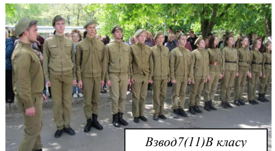
Взвод 7(11)В класу