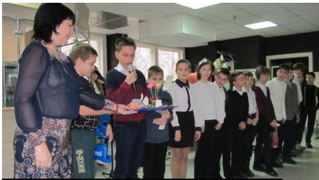
учні 1В класу, 2015-2016н.рік

Я, ти, він, вона, Тисяча - одна сім'я. Вчитель, мама, тато, Нас усіх багато: Кароокі та льняні, Рижі, білі, золоті, Дружні та веселі Маємо оселю, що єднає наші "я" – Матінка ГІМНАЗІЯ!