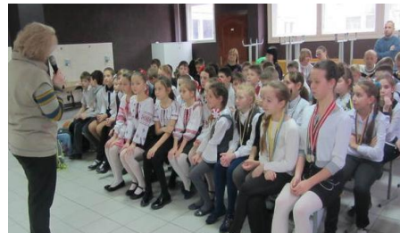
вітання першокласникам від директора

Гімназія (від грец. γυμνάσιον «вправляюсь у гімнастиці») — навчальний заклад для отримання базової та повної середньої освіти. Але, зазвичай, якість та рівень освіти у гімназіях значно вищий, тому гімназію можна назвати елітною школою як приватної, так і державної власності, для обдарованих дітей.